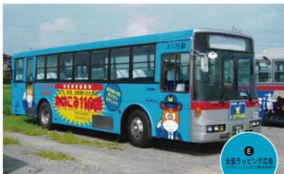
E 全面ラッピング広告 Full-wrap advertising

大きいから、動くから・・・街で、地域で・・・抜群の宣伝効果を発揮します。 身近で公共性の高いバス広告は幅広い消費者にアピールします！