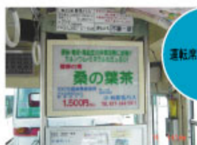
F 運転席後部電照広告 Rear seat lighting advertisement