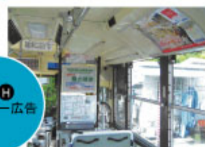
G H ポスター広告 Poster advertising