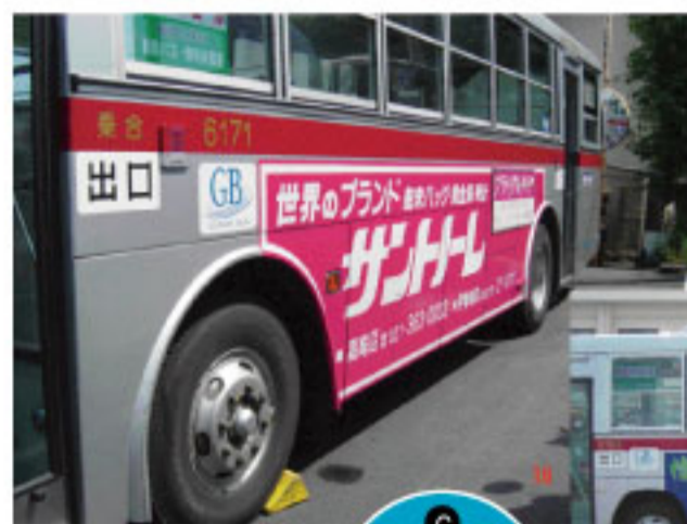
C ワイド広告 D ハーフラッピング広告 Half-wrap advertising